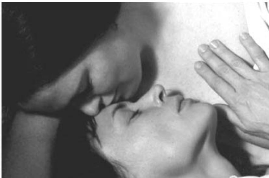
Az egység élmény utáni vágy (Bergman, 1971)

Anna azt mondja, felidézve édesanyja jelenlétét, hogy most már felnőttként érti anyja közönyét, türelmetlenségét, sóvárgását, magányát. Hogy ez nem miat-