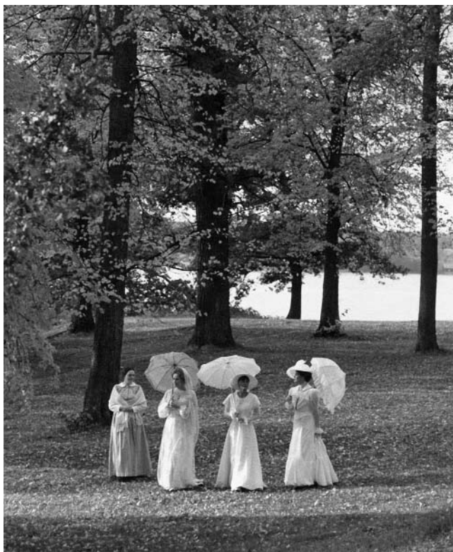
Három nővér a „Suttogások, sikolyok”-ban (Bergman, 1971)

Idő a századforduló, színhely egy egykoron gazdag vidéki kastély. Szülei halála óta Ágnes egyedül él ott Annával, a szolgálólánnyal. Két évvel idősebb nővére és húga férjnél van, gyerekeik vannak. Most Ágnes betegsége miatt jöttek vissza gyermekkoruk színhelyére.